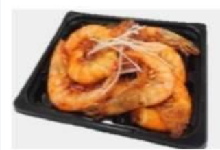
●えびのヤンニョム和え