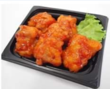
●ヤンニョムチキン