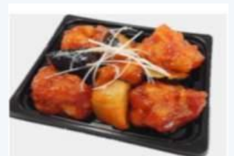
●鶏となすのヤンニョム和え