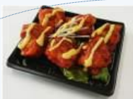
●ヤンニョムチキン ハニーマスタード添え